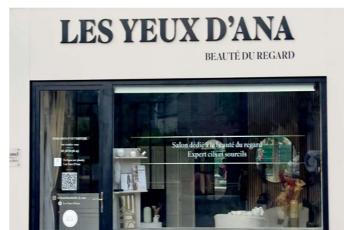
LES YEUX D'ANA

52 Av. du Mal. de Lattre de Tassigny | 09 56 04 10 02